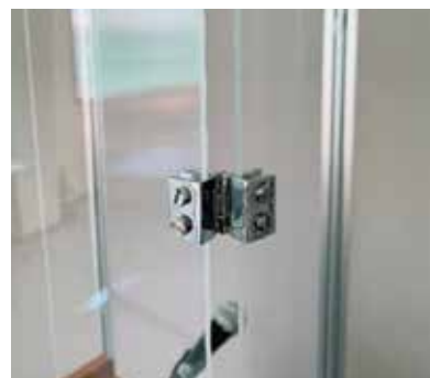
◆ 接合部ズーム 固定金具でしっかり接合