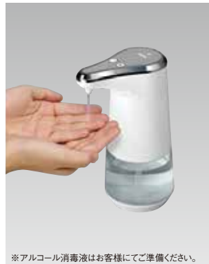
※アルコール消毒液はお客様にどうぞ準備ください。