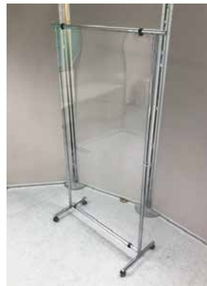
VP-18 簡易透明パーテーション [9600] W950 D450 H1700 板面:透明ペット板 フレーム:クロームメッキ ※キャスター付き