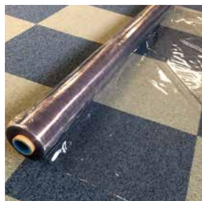
VP-5 透明ビニールクロス [2000] メーター売り 厚み:0.2mm 幅:1830mm アルロン帯電防炎・静電気防止+防炎機能付き ※当社既存のレンタル商品と組合せ、 多様なサイズの透明ビニールクロスを使用し、 飛沫感染防止。 ※設置はお客様にてお願いします。