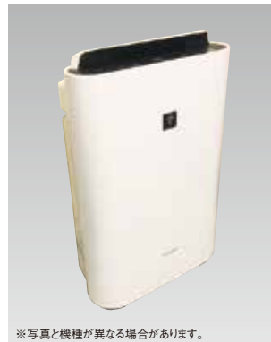
※写真と機種が異なる場合があります。