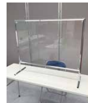
VP-16 卓上透明パーテーション [7600] W910 D280 H765 T25 開口部:W860 H150 板面:透明アクリルパネル フレーム:クロームメッキ