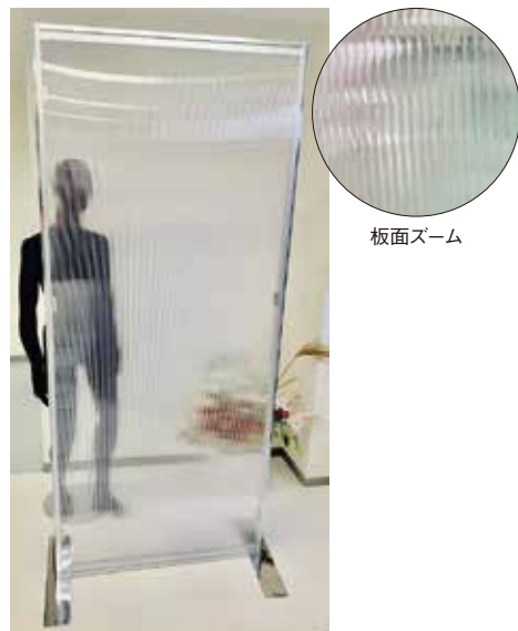
VP-12 透明パーテーション [13600] W900 D500 H2100 T35 板面:透明中空複層パネル フレーム:アルファパネルEZ