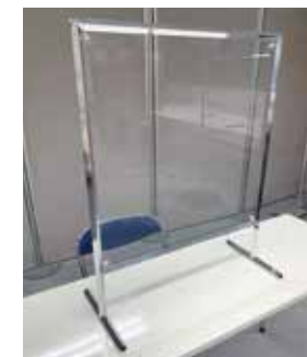
VP-15 卓上透明パーテーション [5600] W620 D280 H765 T25 開口部:W570 H150 板面:透明アクリルパネル フレーム:クロームメッキ