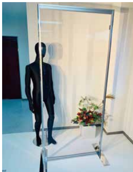
VP-11 透明パーテーション [18400] W900 D500 H2100 T35 板面:透明ポリカーボネートパネル フレーム:アルファパネルEZ