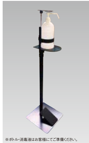
※ボトル・消毒液はお客様にどうぞ準備ください。

4800 W90 D120 H195 電源:単三形アルカリ乾電池4本 タンク容量:320ml ※アルコール消毒液専用 ※電池式(納品時電池設置)