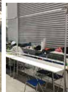
◆ 施工カウンターで 透明ビニールクロス 〈使用レンタル備品〉 K-58-4×2 K-202×2 K-203×2