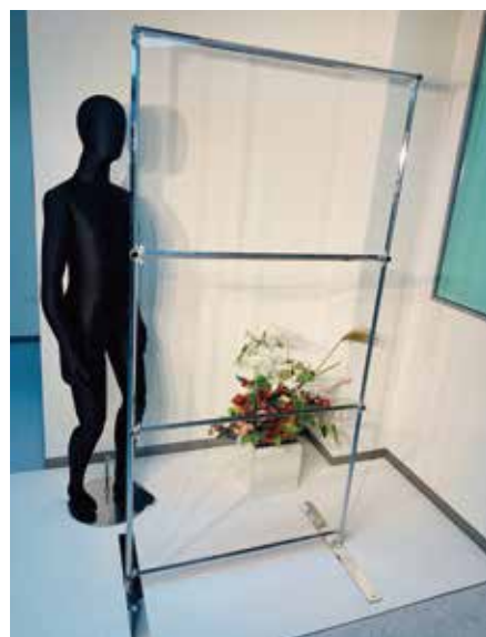
VP-14 透明パーテーション [20000] W910 D600 H1870 T25 板面:透明アクリルパネル フレーム:クロームメッキ