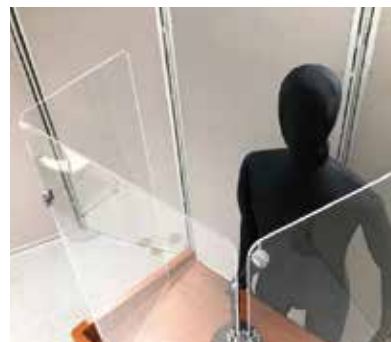
◆ 三方向への飛沫感染防止