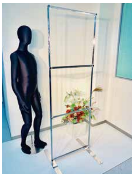
VP-13 透明パーテーション [14800] W620 D600 H1870 T25 板面:透明アクリルパネル フレーム:クロームメッキ