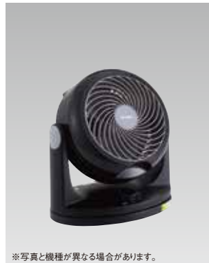
※写真と機種が異なる場合があります。

10000 W350 D200 H500 消費電力:43w ※プラズマクラスター空気清浄機入荷 W399 D230 H613 消費電力:53w