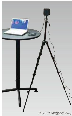
※テーブルは含みません。